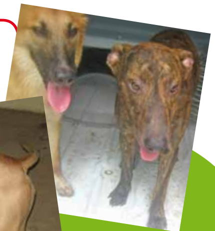
Chiens capturés le jeudi 15 décembre 2011 lors de la première opération de ramassage de chiens errants sur le domaine public dans le périmètre de la Commune de Bourail.