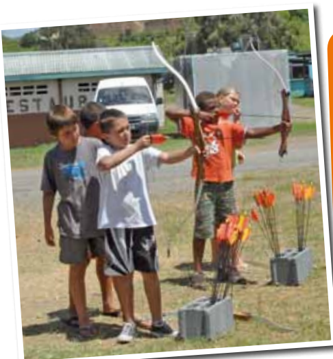
Le tir à l'arc, une nouveauté cet été