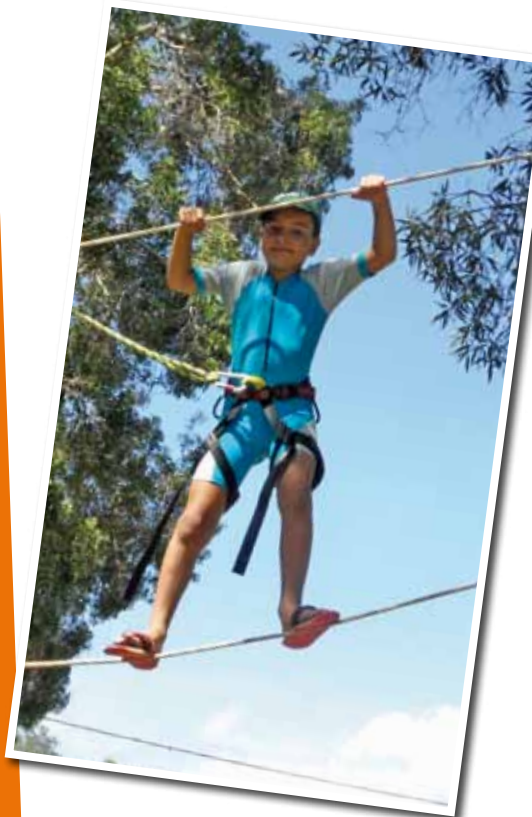
L'accrobranche pour tous

Innovation cette année : la collaboration de la mairie de Moindou qui a contribué à la participation d'une vingtaine d'enfants originaires de cette commune aux centres de vacances de Téné.