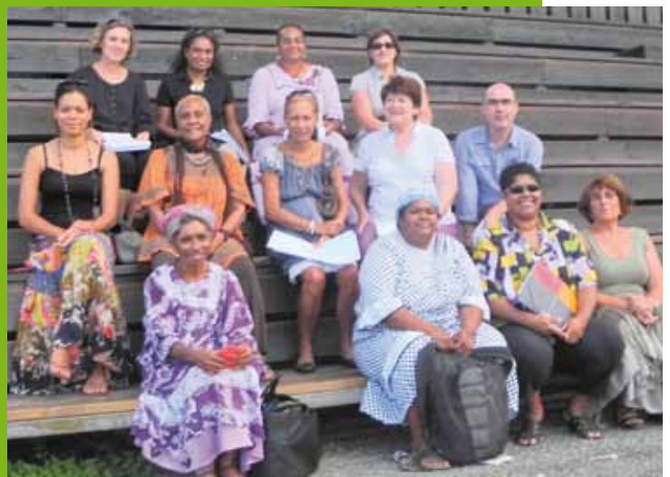
Lors de la journée préparatoire, le 18 janvier dernier.

tremplin pour avancer. Enfin, il y aura des interventions de professionnels qui peuvent les accompagner dans leurs projets et les sensibiliser à des actions sociales, à la santé, etc. Ce